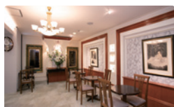
新宿本店 TEL 03-5371-2522