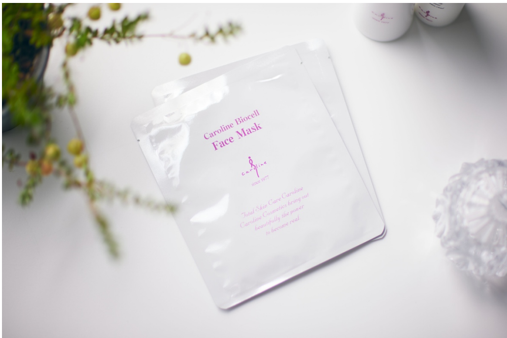
<キャロリーヌ バイオセル フェイスマスク>