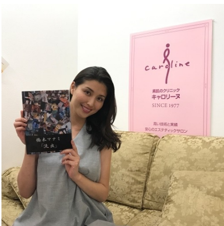
3月に発売された写真集「流出」と一緒に

いつもやっていただくのは、『眼元快足（足裏マッサージ）』です。マッサージ中から内臓が動き始めるのが分かり、むくみが取れるだけでなく、お通じも良くなります。私は疲れやストレスが溜まると、肩甲骨の辺りが凝って息苦しくなってしまうのですが、『リンパ快源』をやっていると肩甲骨周りが軽くなって良く眠れます。フェイシャルでのお気に入りメニューは、『経絡美眼』。目は疲れるとたるみやすくなりますよね。目立つ場所ですし、やはり一番気になります。それが、施術後は眼がぱっちりとして、顔全体が引き上がった感じになるんです。『経絡美眼』には肩と頭のマッサージにフェイスパックも付いていて、気になる部分のお手入れが一度に全部できる、満足度が高いメニューです。自宅では、キャロリーヌオリジナル化粧品を使ってお手入れしています。『コントロール クレンジング』を使うようになってから、小鼻の黒ずみがきれいになりました。お肌に元気がないときは、『プレミアムフェイスマスク』を使います。本当にお肌がプルプルになるのでおすすめです！